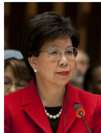
Margaret Chan WHO-Generaldirektorin

Das Rahmenkonzept für die Europäische Region ist eng an das Zwölfte Allgemeine Arbeitsprogramm der WHO angelehnt und ist eine praktische Umsetzung eines Reformprogramms in der WHO, mit dem versucht wird, die Organisation zu befähigen, in einer sich rasch verändernden Welt wirksamer auf den Bedarf der Mitgliedstaaten zu reagieren. In der Europäischen Region setzen die in diesem Rahmenkonzept angestrebten Ergebnisse wie in anderen Regionen voraus, dass internationale Organisationen nicht nur lediglich mit ausgewählten Fachministerien zusammenarbeiten, sondern mit allen maßgeblichen Teilen der Regierung, mit Kollegen in anderen internationalen Organisationen mit einem Einfluss auf Gesundheit sowie mit der Industrie, der Wissenschaft und der Zivilgesellschaft. Das Rahmenkonzept für die Europäische Region weist den Weg für neue Ansätze zu Gesundheit und Wohlbefinden weltweit.