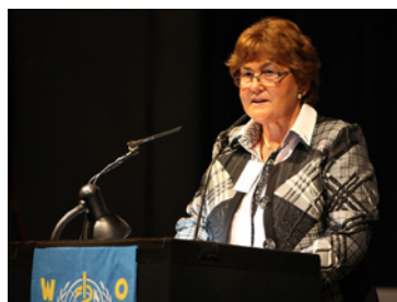
Zsuzsanna Jakab WHO-Regionaldirektorin für Europa

„Gesundheit 2020“ ist ein Konzept der WHO und gleichzeitig ein Konzept für alle. Es baut auf einer langen Geschichte globalen und regionalen politischen Denkens auf und ist vollständig an der im Gange befindlichen Reformierung der WHO ausgerichtet. Das Regionalbüro wird seine Umsetzung in den Mitgliedsstaaten aktiv fördern und unterstützen. Die WHO kann dieses Rahmenkonzept jedoch nicht aus eigener Kraft zum Eckpfeiler von Gesundheit und der Verbesserung von Gesundheit und Wohlbefinden machen und wird zur Verwirklichung dieses Ziels mit vielen Partnern zusammenarbeiten. Gemeinsam können wir bewirken, dass Politikgestaltung und Steuerung für mehr Gesundheit besser an den heutigen Erfordernissen ausgerichtet werden, und Maßnahmen ergreifen, um die Gesundheit und das Wohlbefinden heutiger und zukünftiger Generationen zu verbessern.