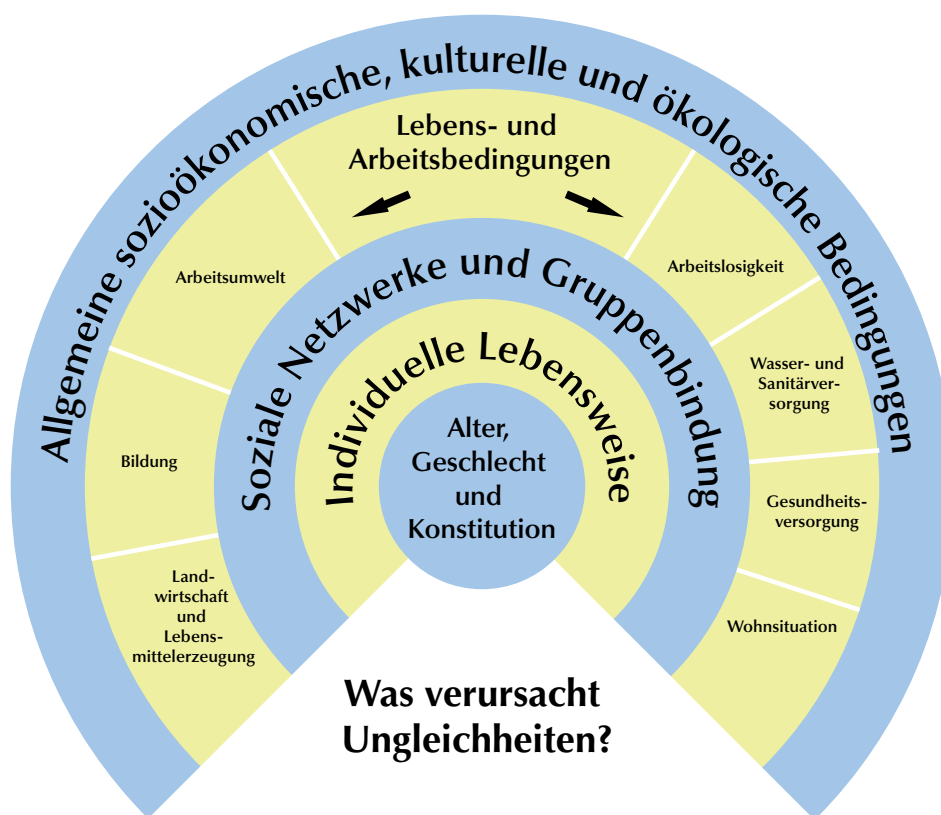
Abb. 1. Die Wechselwirkungen zwischen den Determinanten von Gesundheit

In Anlehnung an Dahlgren und Whitehead (40).