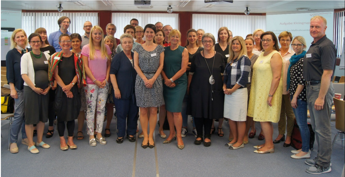
Foto: Mitglieder der AG Gesundheitsziel 9 sowie der fachlichen Begleitung und der Prozessbegleitung anlässlich der Sitzung im Juni 2017